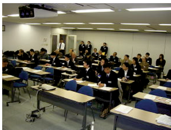
熱心に聞き入る参加者の皆さん